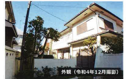
外観 (令和4年12月撮影)